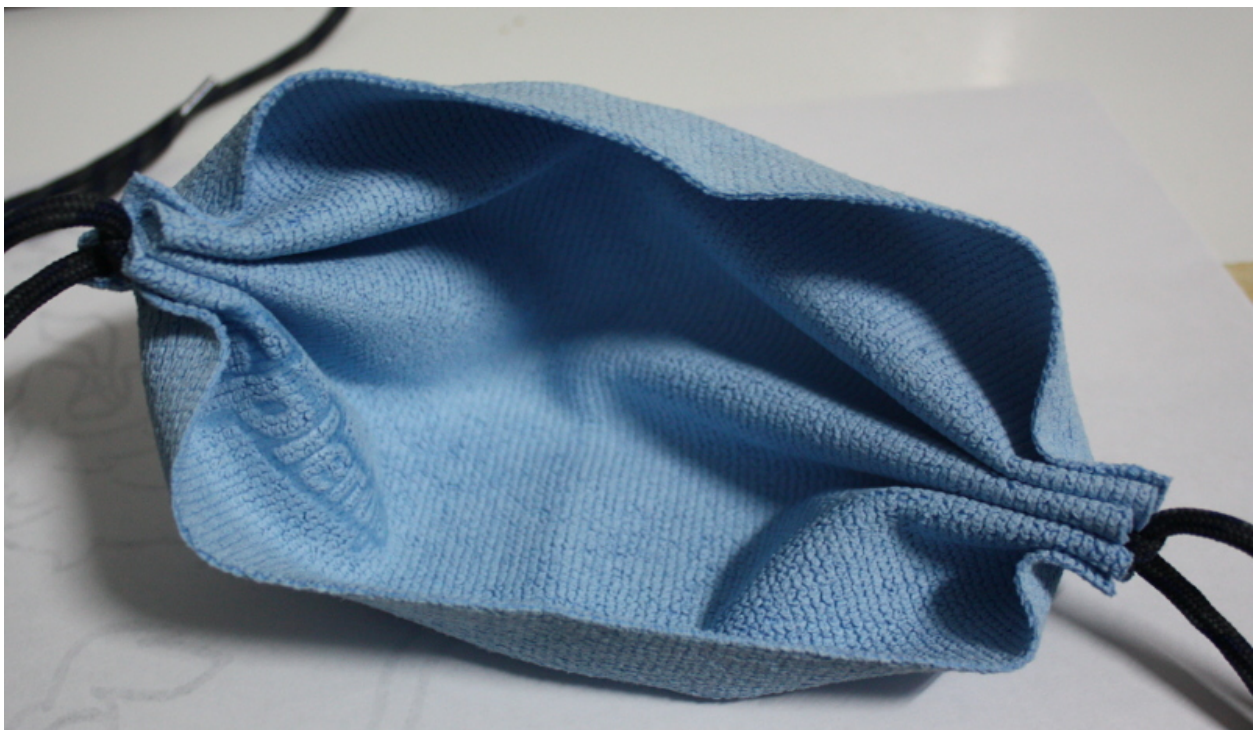
tuch in der mitte wieder auffalten